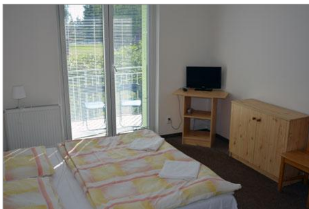
ubytování – hotelový pokoj